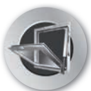
FÖNSTERTEKNIK OCH BRANDVENTILATION